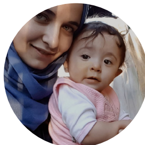
> Pour Sama de Waad AL-KATEAB et Edward WATTS (Syrie)