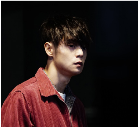
> First Love, le dernier Yakuza de Takashi MIIKE (Japon)