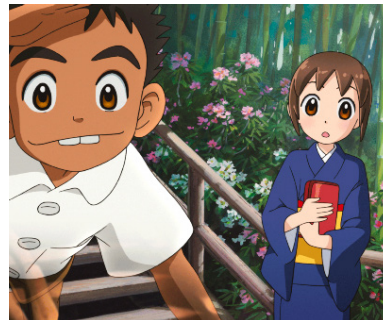
> Okko et les fantômes de Kitarô Kôsaka (Japon)