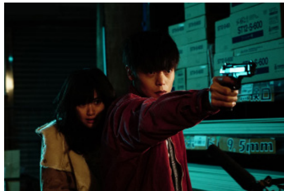
> First Love de Takashi MIIKE (Japon)