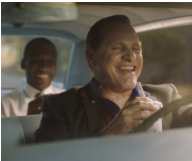
> Green Book (Sur les routes du Sud) de Peter FARRELLY (Etats-Unis)