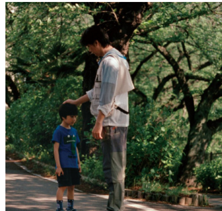
> Tel père, tel fils de Hirokazu KORE-EDA (Japon)