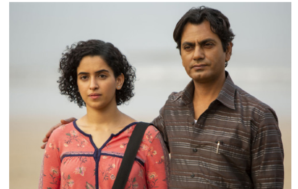
> Le Photographe de Ritesh BATRA (Inde)