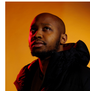
> Shola AMOO réalisateur de Last Tree