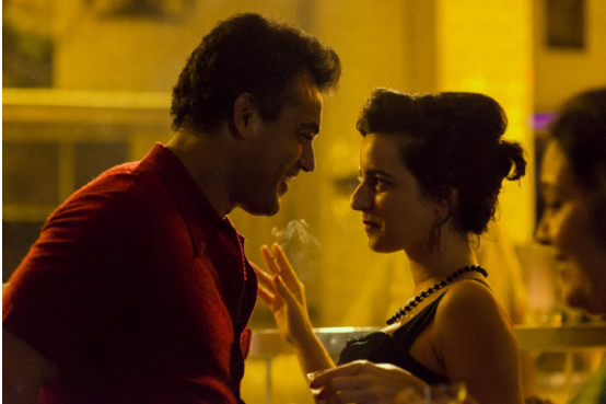
> La Vie invisible de Eurydice Gusmao de Karim AINOUIZ (Brésil)