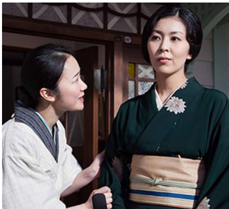
> La Maison au toit rouge de Yoji YAMADA (Japon)