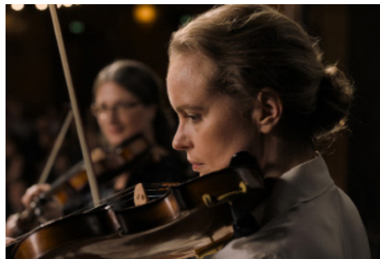
> L'Audition de Ina WEISSE (Allemagne)