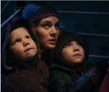
> Le vent de la Liberté de Michael BULLY HERBIG (Allemagne)