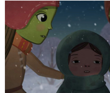
> Willy et le lac gelé de Zsolt PÁLFI (Hongrie)