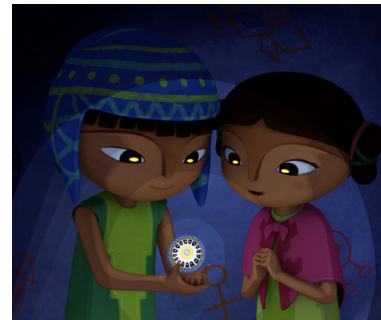
> Pachamama de Juan ANTIN (France - Canada - Luxembourg)