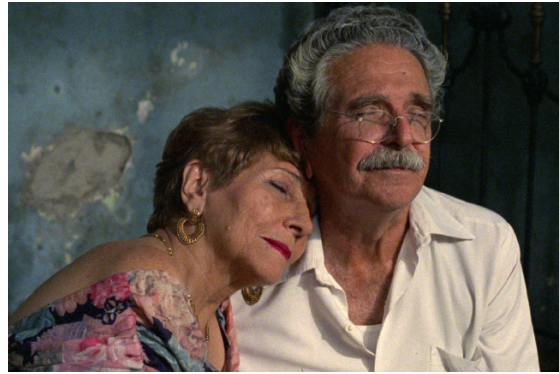
> Guantanamera : Film d'ouverture de Tomas GUTIERREZ ALEA et Juan Carlos TABIO (Cuba)