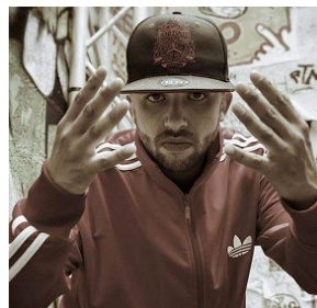
> Motta rappeur toulousain