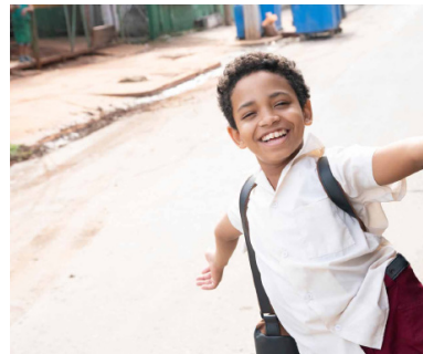
> Yuli de Iciar BOLLAIN (Espagne)