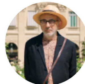
> It Must Be Heaven de Elia SULEIMAN (Palestine)