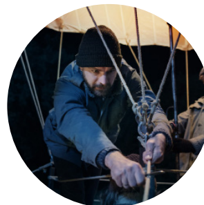
> Un Vent de Liberté de Michael BULLY HERBIG (Allemagne)