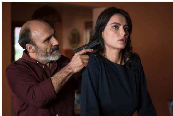
> Les Siffleurs de Corneliu PORUMBOIU (Roumanie)