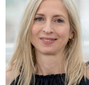
> Jessica HAUSNER réalisatrice du film Little Joe