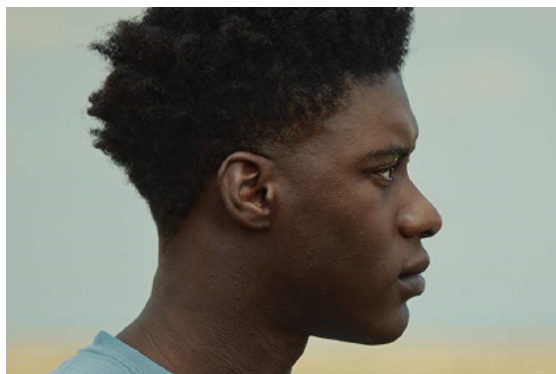
> The Last Tree de Shola AMOO (Grande-Bretagne)