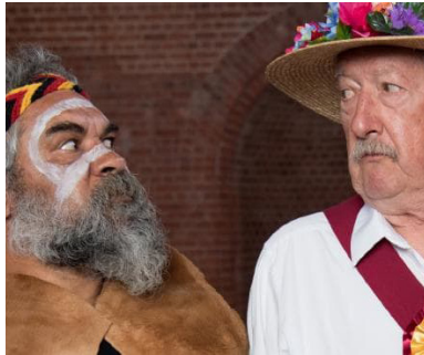
> Three Summers de Ben ELTON (Australie)