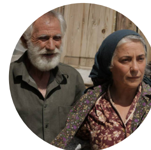
> Moskvitch, mon amour de Aram SHAHBAZYAN (Arménie)