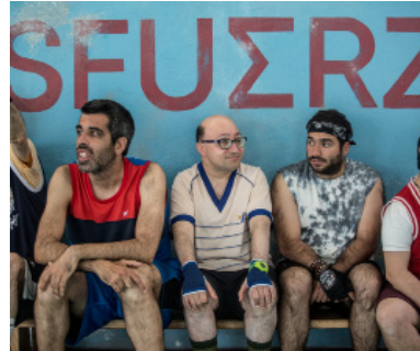
> Champions de Javier FESSER (Espagne)