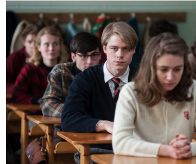
> La Révolution silencieuse de Lars KRAUME (Allemagne)