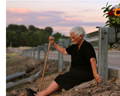
> Le Silence des Autres de Almudena CARRACEDO et Robert BAHAR (Espagne)